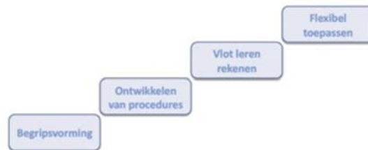
Figuur 2: Hoofdfasen leerlijn, ERWD Protocol, 2011