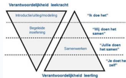
Figuur 5: Gradual Release of Responsibility Instruction Model (GRRIM), 2008