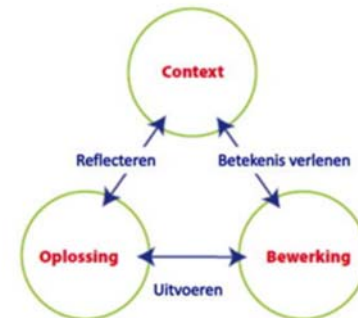
Figuur 3: Drieslagmodel, ERWD Protocol, 2011