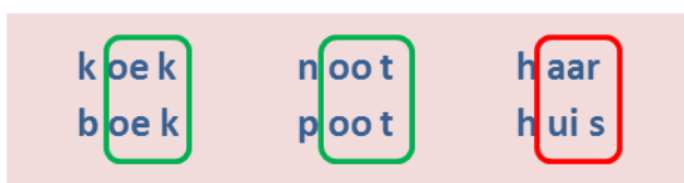
Figuur 2: visualiseren van rijm

Door dit met een groene stift te omlijnen wordt de instructie nog explicieter gemaakt. Vormen die niet hetzelfde zijn worden met rood gemarkeerd: deze rijmen dus niet.