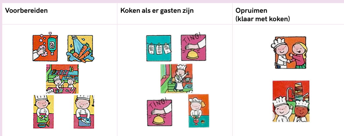
Figuur 2 – Splits sessie 2 op in meerdere momenten (voorbereiden, koken als er gasten zijn, opruimen na het koken)

Observeer als leerkracht welke rollen en handelingen je al terug ziet komen tijdens het spel in de hoek. Bekijk dit per onderdeel en breidt dit samen met de leerlingen verder uit. Bespreek welke rollen en rolgebonden handelingen er passen bij het voorbereiden, koken en opruimen. Zorg voor materialen, benodigdheden; denk aan groenten, een mes, keukengerei en een schort die de kok nodig heeft. Sessie 2 kun je opsplitsen in meerdere momenten, dus eerst het voorbereiden uitgebreid bespreken en inoefenen in het spel in de hoeken, dan koken en daarna opruimen. Het spelscript wordt dan per onderdeel gedetailleerder. De gedetailleerde plaatjes worden er per onderdeel onder geplakt. De rol van de leerkracht is observeren of de rolgebonden handelingen intenser en langdurig zijn. Welke nieuwe woorden worden betekenisvol gebruikt? Als leerkracht stuur je steeds weer op tekstinhoud door tekstgerichte vragen te stellen, zoals: wat doet de kok tijdens de voorbereidingen?