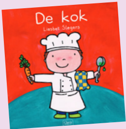
Het boek De kok