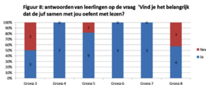
Figuur 7 en 8. Antwoorden van leerlingen op de vraag 'vind je het belangrijk dat de juf samen met jou oefent met lezen?' uit onderzoek in 2012-2013 en 2013-2014.