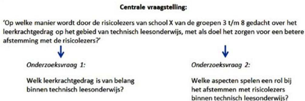
Figuur 1. Opzet van onderzoek