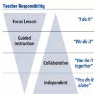
Figuur 3. Teacher responsibility model (fisher, 2013).