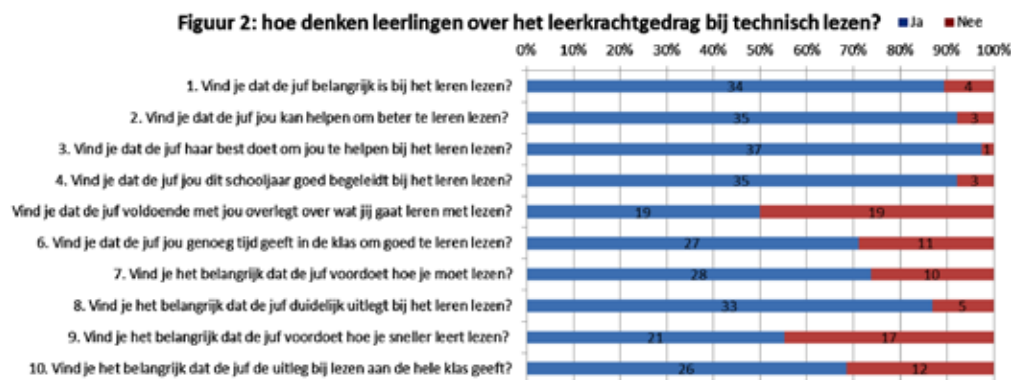
Figuur 2. Antwoorden van de leerlingen van groep 3 t/m 8 omtrent leerkrachtgedrag bij technisch lezen (n=38).