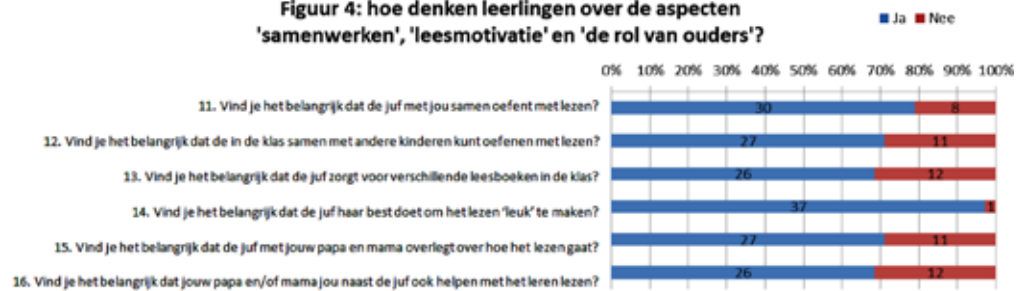
Figuur 4. Hoe denken leerlingen over de aspecten 'samenwerken', 'leesmotivatie' en 'de rol van ouders'?

Om ervoor te zorgen dat voorgenoemde aspecten voldoende aandacht krijgen op school, kan de remedial teacher vanuit coördinerende leeslessen observeren en leerkrachten van advies voorzien. Doorlopende lijnen moeten besproken worden en besef bij alle betrokkenen in school over wat ertoe doet bij het leren lezen, moet centraal staan.