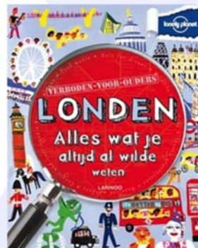
Lonely planet verboden voor ouders - Klay Lamprell