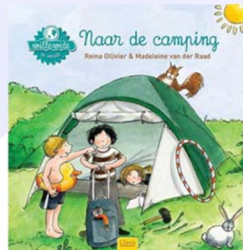
Naar de camping - Reina Ollivier

Tal van mogelijkheden dus, als het gaat om zomer, voetbal, activiteiten, campings, steden, topografie, het ontstaan van vakantie en meer.